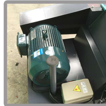
High Power Motor